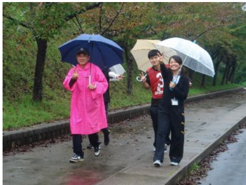
実習『自然体験活動の技術：ウォークラリー』