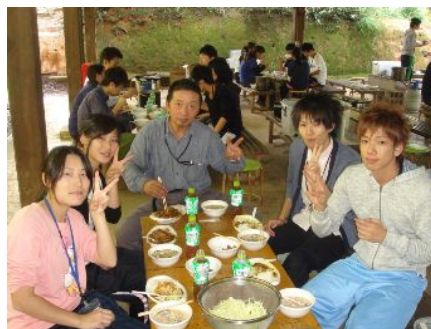
実習『自然体験活動の技術：野外炊飯』