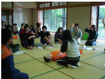
実習『学ぼう！いのちの救い方：救急救命講習』