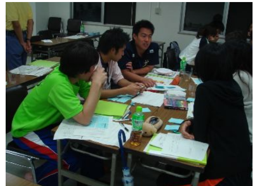
演習『プログラムの企画・立案』