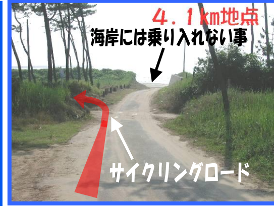
⑦ 左折してサイクリングロードへ入る