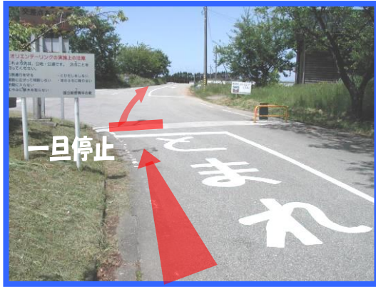
① 交流の家正門を直進