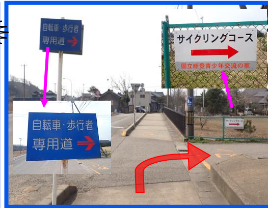
⑥ 「自転車専用道」の看板を右折する