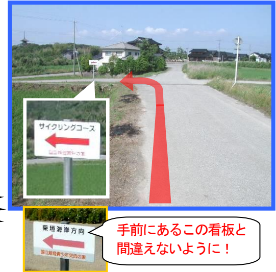
④ 海を左手に見ながら進み、看板を左折