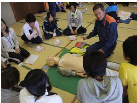
実習『学ぼう！いのちの救い方：救命救急講習』