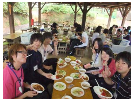
実習『自然体験活動の技術：野外炊飯』