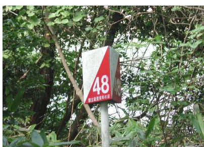
ポスト コース上に設置