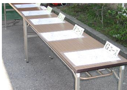
本部：玄関前 スタート・ゴール マスターマップ設置