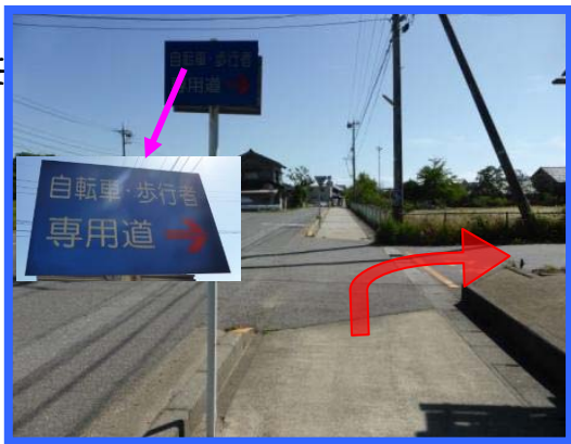
⑥ 「自転車専用道」の看板を右折する