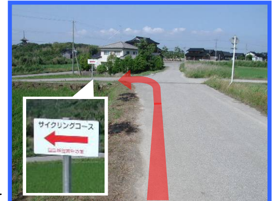
④ 海を左手に見ながら進み、看板を左折