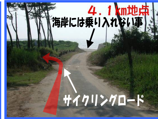
⑦ 左折してサイクリングロードへ入る