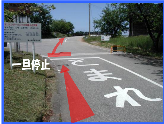
① 交流の家正門を直進