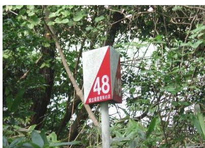
ポスト コース上に設置