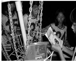
【ナイトアドベンチャー】 仲間と協力してポイントを見つけ出せ！ 信頼感を築くねらい。