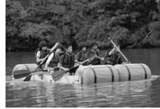
【いかだ】 協力して組み立て！&こぐ！