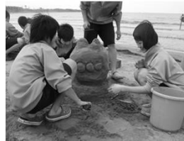
【砂像作り】 海岸へ行って砂を固めたり、削ったりして砂像をつくるよ！