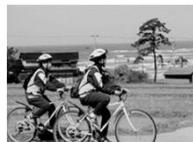
【サイクリング】 潮風を受けながらサイクリングコースを走行し、爽快感を味わうことができる。