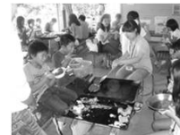
【野外炊飯】 協力して食事をつくり、ともに食べる楽しさを味わうことができるよ。

私たちがプログラム作りのお手伝いをします！プログラムについてもっと知りたい方、興味を持った方はお気軽にお問い合わせください。