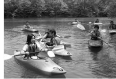
【カヌー】 スピード感！技術力向上！