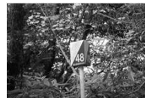
【オリエンテーリング】 地図をたよりにポストを探して時間内にゴールする活動。