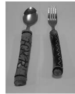
【マイスプーン作り】