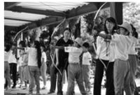
【アーチェリー】 洋弓を用いて的に矢を当てる活動。当たったときの感動はひとしお！