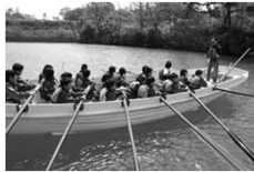
【カッター】 全員で息を合わせて！