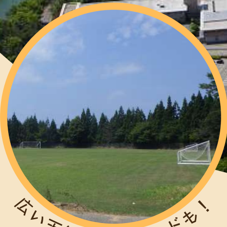
広い天然芝グラウンドも！