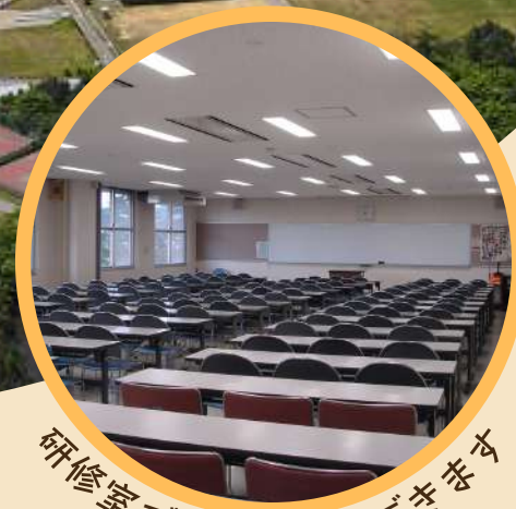
研修室で学習活動もできます