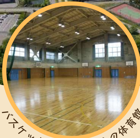
バスケットコート2面分の体育館