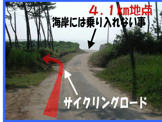
⑦ 左折してサイクリングロードへ入る