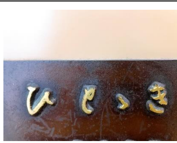
②ゆっくりしませんか? (5点)