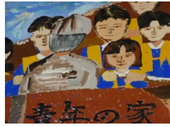
③この壁画は大きいよ! (5点)