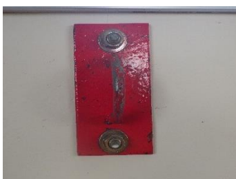
⑰はしごをかける場所だよ (20点)