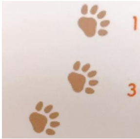
⑤この足跡はだれ? ヒノ (5点)