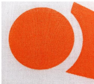
⑨不思議な図形が (10点)