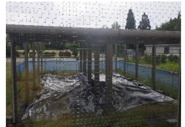
⑫ちょっと外を見てみよう (10点)