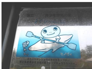
⑱小さなヒノビィが! (20点)