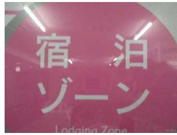
⑥3つのゾーンがあるよ (5点)