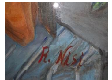
⑯勉強のあいまに (10点)