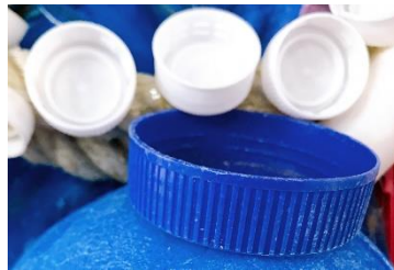
⑮キャップがいっぱい! (10点)