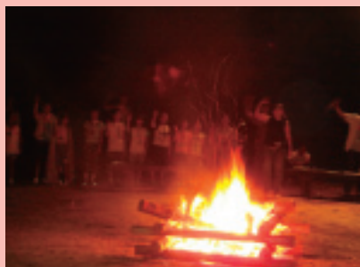
※写真は、今年8月に実施された「①サマー編」の時の様子です。

📅 子どもたちの1泊2日のイベントを企画し、体験活動の支援や子どもたちとのふれあいの中で、ボランティア活動の楽しさや喜び、達成感や充実感を味わいます。